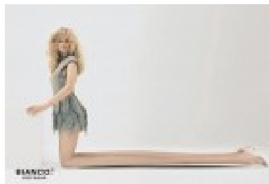
А это leg